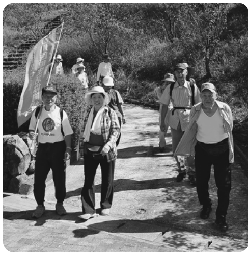
公園の秋の気配を感じながら