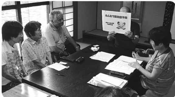
一宮支部・すみれ班 初回は紙芝居でワクワク...

どの会場でも参加者が積 極的に準備し、「良く笑っ たな。面白かったね。」 と、次回が来るのを楽しみ にしています。