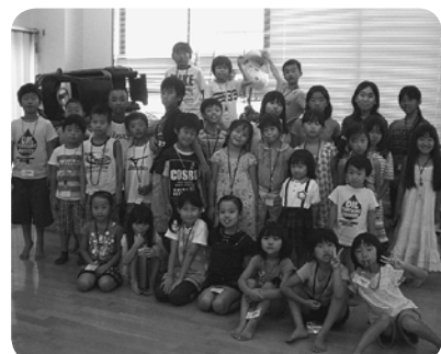
2013年 夏休みこどもクラブ

介護施設を併設し、子供からお年寄りまで全世代が交流でき、地域貢献もしやすく集える場所に...という皆の夢に向かって南ブロックは一丸となり建設運動を開始。更に予算がオーバーしたけれど、必死で出資金を集め、二〇〇六年に現在