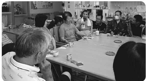
それぞれの想いが交流する茶話会

患者さま、担当した職員からは「お菓子を食べながらだと緊張せずに話せるし、こういう場が持てて良かった」「障害を持った患者さまのつらい思い、様々な話や意見を聞き心に響いた」「普段、無表情の患者さまの笑顔がみれて嬉しかった」等の意見が聞かれました。