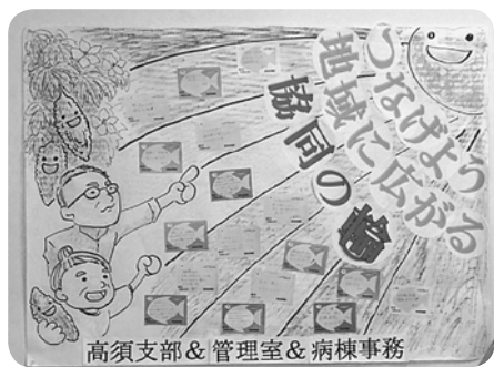
決意のタペストリー

九月十四日、東エリアの平和活動報告会の後行われたキックオフ集会には職員四十二名、組合員二十三名が参加、職場と支部が訪問日のすり合せを行い、ひとりひとりの決意をタペストリーに貼り付け、前に出て組合員ふやし「せ」の行動」の意気込みを発表。