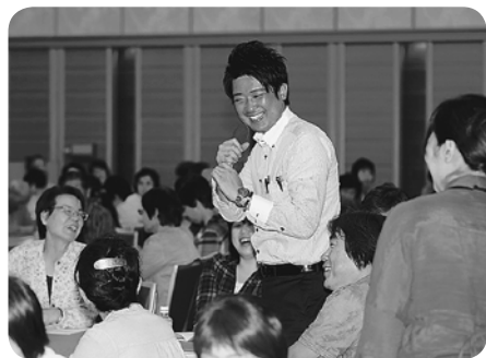
各グループで楽しい交流がされました

活動の全体像とともに、とりわけご自身が所属する岡山医療生協で「健康チャレンジ」の活動を自治体やJAなど協同組合との協同を広げながら毎年積み上げてきたこと。そして、その取り組みの広がりの中で班が増え、医療生協運動の新しい担い手さんが次々と誕生していることなどが具体的に紹介されました。