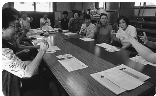
高須支部・3班で合同班会 じゃんけんゲームで大笑い!