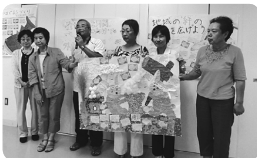
木太支部と通所リハビリ職員 一緒にがんばるぞ〜!

今年度の行動の特徴は、あらかじめ訪問先に加入の訴えと訪問の予告の手紙を送付したこと。これを受け取った未加入患者様から、外来で三名が自ら加入を申し込まれたり、「次の受診の時に加入します」と電話が入るなど嬉しい成果がありました。