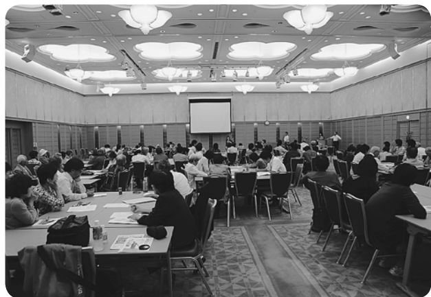
「多くの学びがあり、会場いっぱいの参加者で元気が出ました」

現在香川医療生協は、健康チャレンジへの一〇〇〇名参加を、健康チャレンジを実践目標にして「健やか高松21」に登録するとともに、高松の各支部ではモデル地区、モデル事業登録に取り組んでいます。