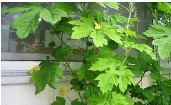
↑花が咲きました。 ↓室内からのようす