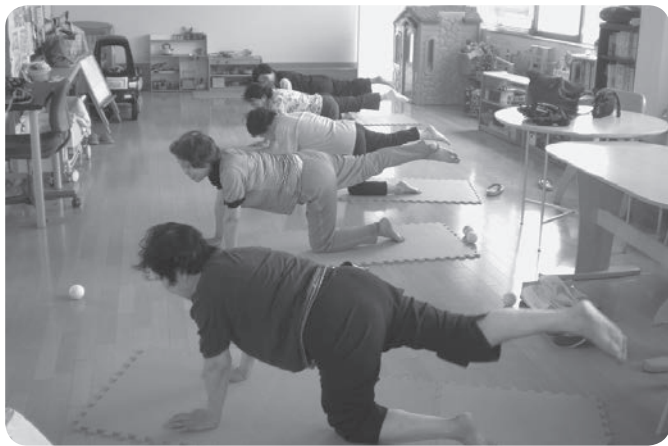
仲間と励ましあって「健康チャレンジ」