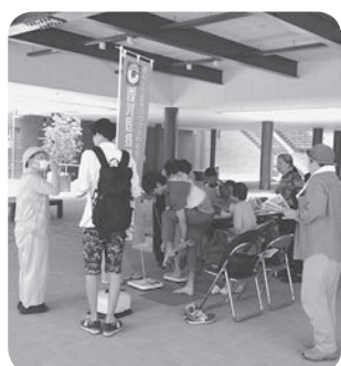
健康チェック・健康相談