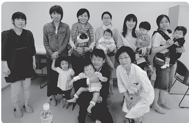
つくし班の皆さんも大満足「見学班会」

が、お薬の使用期限はあるの？ をすすめるられたが本当に大丈夫か？ TVでよく宣伝しているサプリメントなどの効果は？薬と併用は大丈夫か？ 家族が在宅で療養しているがお薬の管理や薬局へ行くのが大変 など薬剤師さんに聞いて