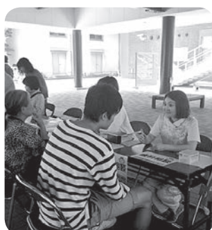
歯科相談・サリバスター