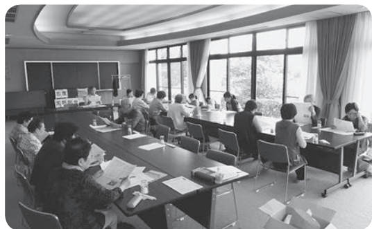
新体制で明るく元気にスタート