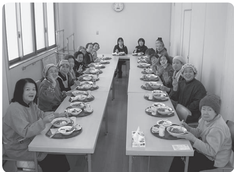
支部で「居場所づくり」に挑戦しませんか

「医療生協の機関紙を手配りするにはできるだけ声かけているの」「洗濯物や新聞などが溜まっているところは気になるわ」「玄関からお声かけしたら、具合が悪く、一人で寝込んでいたのがわかったの」など、機関紙の手配りさんの活動が「高齢者世帯への見守り活動」につながってきています。可能なところから自治体などと「見守り協定」を結んでいきま