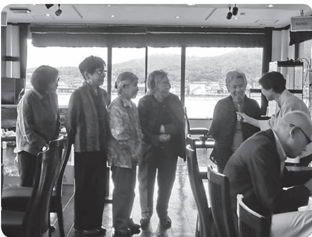
ますます広がる「脳いきいき」班会

総会では、ひとりぼっちの高齢者をなくしたい...との思いから作った「あすなろ会」の活動の紹介と「脳いきいき班会」とは?の説明をしました。