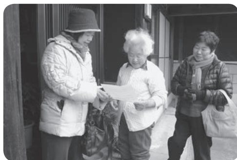
お変わりないですか？高須支部の高齢者訪問

★「高齢者居場所づくり事業」に参加しませんか。すでに数箇所の支部で「ふれあいサロン」「お食事会」「口コミ体操のグループ」などが取り組まれています。いま地域の中で、高齢者の介護予防や健康づくりの推進をめざして、高齢者が気軽に集える「居場所づくり」を行政が呼びかけ、施設整備や運営などの助成金なども設定しています。昨年一年間、夢プラン委員会をはじめ様々な場で「どんなまちに住み続けたいか」支部で問いかけ地域ごとに相談されているプラ