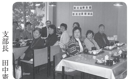
みんなが主役! 香南町支部再建