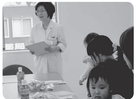
何でも聞ける おくすり班会