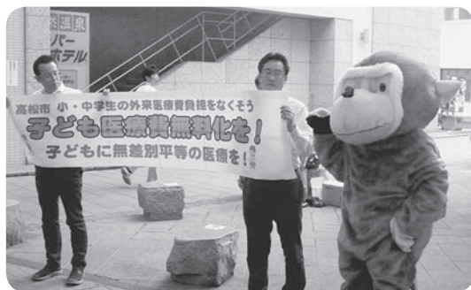
多くの市民の皆さんが署名に快く協力!!

県都・高松市では民主市政をきざしく高松市連合会が「中学卒業までの医療費無料化を求める署名」をすすめて、去年五月三十日約二〇〇〇筆と要望書を市長に提出しました。わたしたち医療生協も大いに協力して現在八〇〇〇筆に達するなど運動を強めて来ました。市議会内外での奮闘もあり「中学卒業まで入院費を四月から無料にする。この八月からは現物給付とする」成果となりました。東讃各地と同様通院費がこれからの課題です。