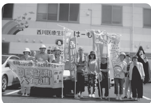
心温まる お接待風景でした