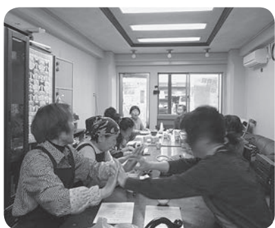
「せっせっせーのよいよいよい」