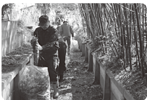
地域住民と一緒に側溝の大掃除!

られた車・瓦礫の山は見かけなくなりました。海岸線に向かつて走るダンプ、朝夕防波堤建設の現場にむかって走る作業員の車のラッシュ、ものすごい数のいちごハウスの建設、一メートルほど土盛りした敷地には建て替える家が建つのでしよう。これだけ見ると確実に復興が進んでいるかのように思ひます。しかし被災者の生活再建、復興はまだまだ：いつになるのかというのが実感です。被災者の方々が一日も早