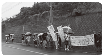
昨年の雨の中の行進

「ぜび、どー一緒に歩きましょう。」 原水爆禁止国民平和行進四国コース(五月七日から十二日間)