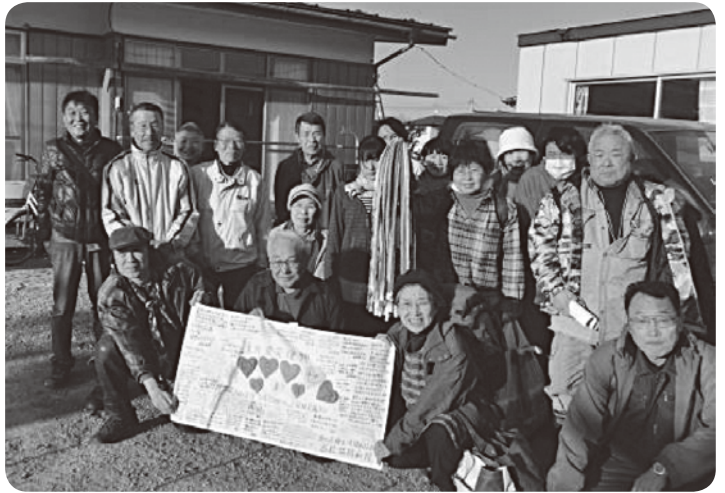
協同病院職員からの寄せ書きを手に地域住民とボランティアの深まる絆

今回香川のボランティアは、仮設住宅で被災者の心と体の健康チェック・健康相談、在宅支援で地域住民と側溝掃除、塩枯れの立木の伐採、リウマチを患った方の庭の片づけなどを行ってきました。 防風林が無くなり、津波が運んだ泥を取り去った田畑は強風で砂が舞い、まともに目も開けられず、耳や鼻に、マスクに守られた口の中にも土と砂という中で作業も