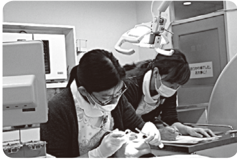
歯周病検査の様子