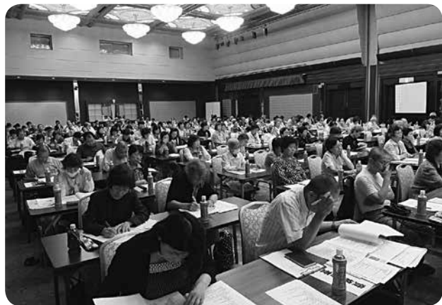
昨年度の総代会の様子

昨年度は「協同組合がよい社会を築きます。」をスローガンに国連が定めた国際協同組合年という記念すべき年でした。そのため「協同っていいな!」をおもいきって広げ、運動の重点としました。特に第二十六回日本高齢者大会イン高松(十月)を、各団体・個人に広くよびかけ、また多くの組合員の参加のもとで成功させることができました。 この開催運動を通じての成果は、①支部が地域に大きく足を踏み出し、つながりをつくりだしたことです。地域のコミュニティセンターや老人会などにでかけ、DVD上映や参加券の普及にとりくみました。その結果、のべ五千百人が参加しました。②農協をはじめとした協同組合の役員、県・高松市の老人クラブ連合会の役員、高松市コミュニティ協議会の役員などが呼びかけ人