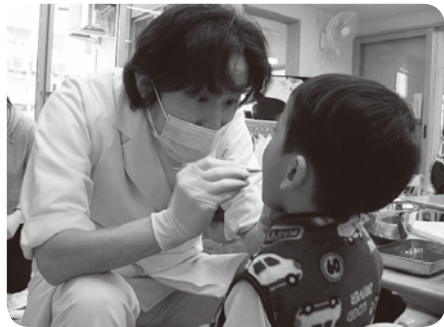
子どもの歯科検診(はい! あ〜ん。)