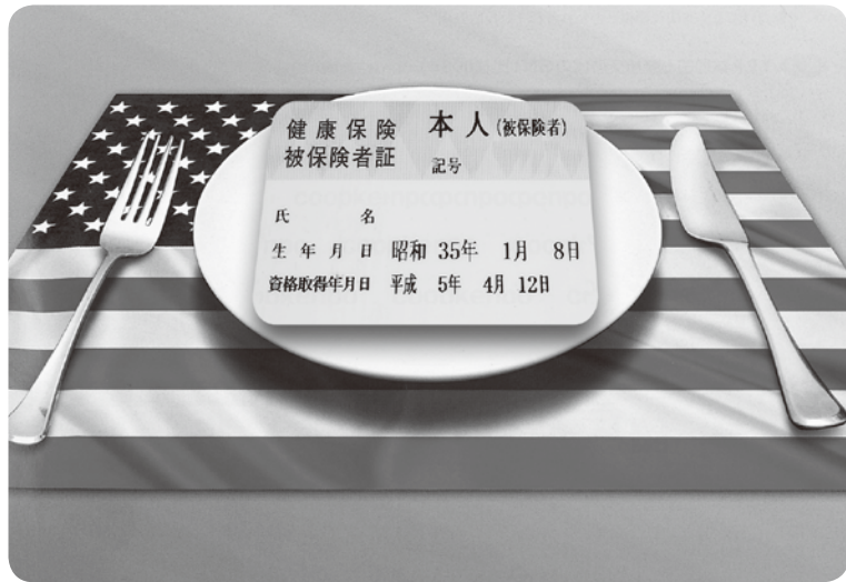
日本の「国民皆保険制度」が食いものにされる

A 日本の法制度に対し、他国がやめてしまえというわけではないでしょう。しかし、TPPに参加すると、