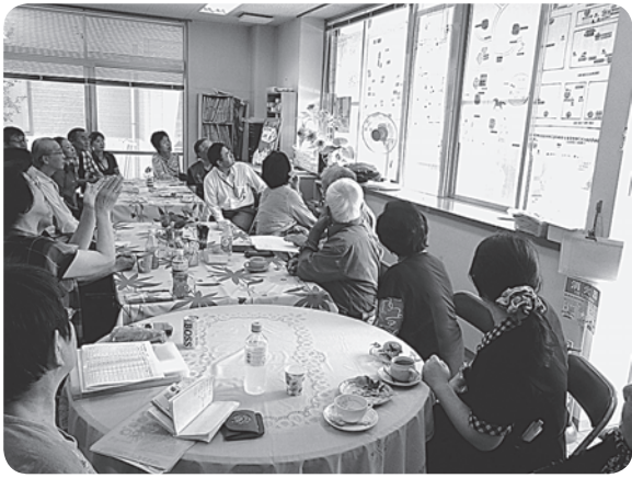
キックオフmikiカフェ

生協強化月間が始まった九月二十五日(金)に、新班が誕生しました。班の名前は、温かく明るい「ひまわり班」と命名。新班は、さぬき南支部に所属し、旧寒川町に位置する西山王地域の人たちで構成されています。班会のきつかけは、他の班会を見学し、私たちも健康チェック班会をしてみたいと思ったからです。班会のサポートに入り、医