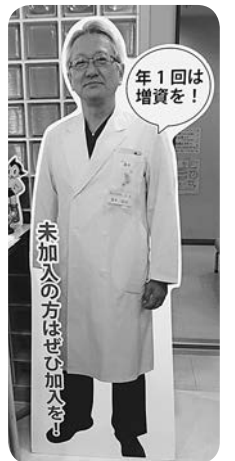
蓮井院長のパネル

「先生が言ってるから気になってました。」と増資に協力して下さいます。皆様にご協力いただきながら患者