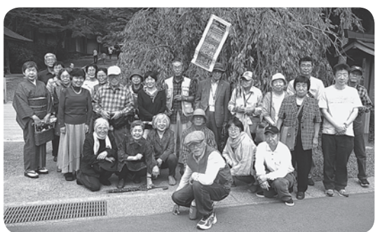
しっかり学び、楽しみ、笑顔いっぱい

今年の日本高齢者大会には、香川から二十五名が参加し、全国の諸活動を交流し、現在日本の諸問題に真剣に取り組んでおられる第一級の学者、専門家の知恵をしっかりと学びました。