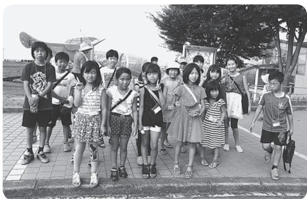
子育て支援へも活動の輪は広がっています。