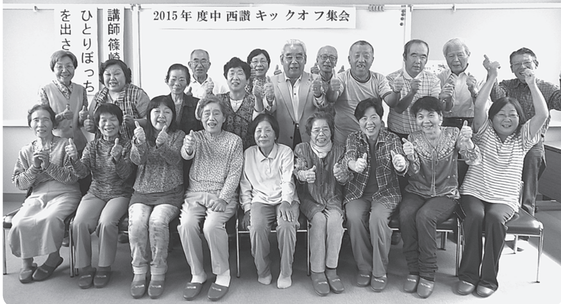
中西讃ではじめてのキックオフ集会。心暖まる感動的な経験が交流されました。