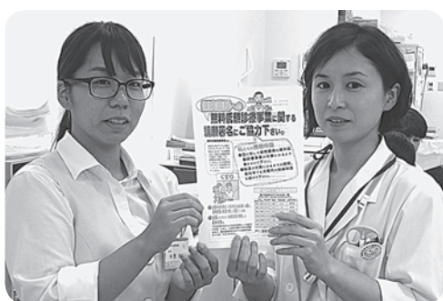
ぜひ、一緒に実現しましょう!!