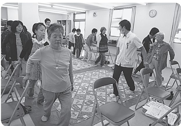
転倒予防のロコモ体操！ 理学療法士が姿勢をチェックしてくれました！

歯科衛生士や理学療法士などの専門職に講師をお願いし①お口の中の健康や嘔む事の大切さ(歯にいいおやつ)の試食もト・あいうべ体操②足指を広げるひろのば体操③ロコモ体操や