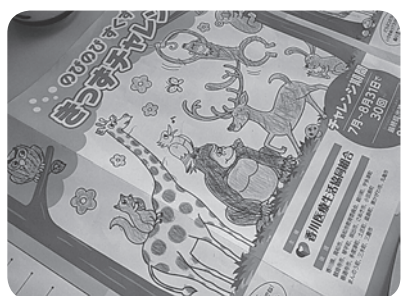
ぬり絵がかわいい♡思わず顔がほころぶ「きつぷチャレンジ」

「いろんな事が人と繋がるきっかけとなる。一人でも多くの人に医療生協の活動の楽しさ、素晴らしさを知ってもらい地域を支える力を広げたい」との思いを胸に、この秋はたくさん活動を行います。医療生協強化月間が始まりました。平和病院の待合室でお声をかけ