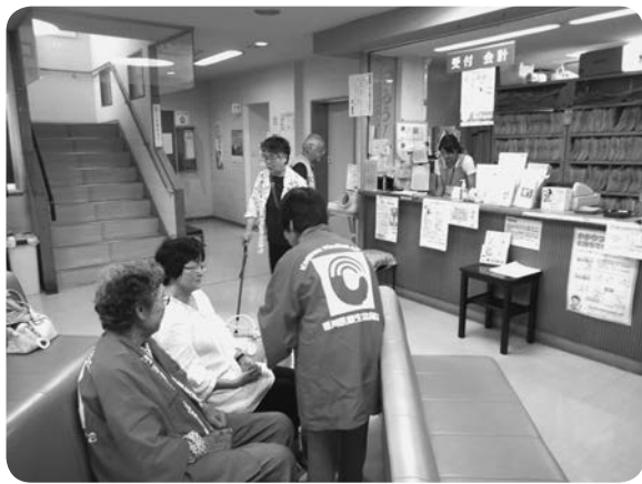
仲間ふやし&チャレンジ行動

坂出支部の「楽しい講座を開催し、支部運営委員ふやし」や丸亀南支部の「班会開催時、新しい人を誘って組合員へ」は、楽しい活動で仲間ふやしをしているの発表でした。