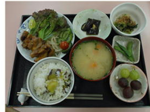
メニュー/サツマイモごはん・豚のみそ漬+焼きナス・ 小松菜のおひたし・枝豆・味噌汁・果物

ランチの試食も行っております。 ケアマネ様数人でお越しください。 事前予約必要ですので ご連絡お待ちしております。