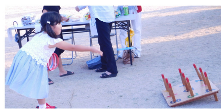
吹き矢と輪投げは、子供達に大人気！！