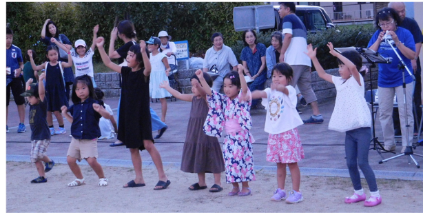
オカリナの演奏中子供達が飛び入りで【パプリカ】を踊ってくれました。