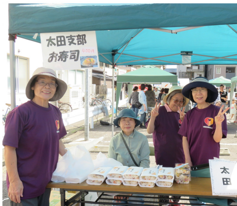
太田支部自慢の五目寿司を出品しました！