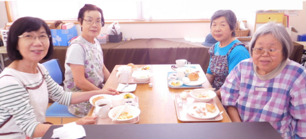
秋の味覚が堪能出来るメニューで、皆様に喜ばれました。