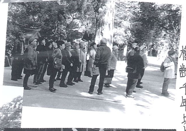
樹齢千年以上の神木がたくさん。