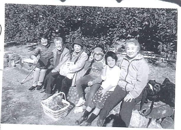
2019年11月23日、坂出市青海町へ みかん狩りに行ってきました。 天気もよく、少し汗ばむくらいでした。♡