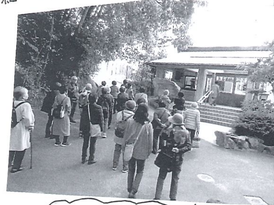
大山祇神社 全国にある山祇神社の 総本社