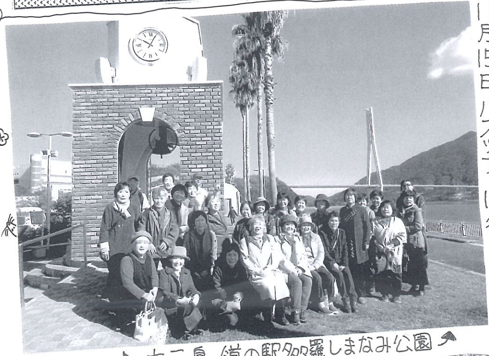
大三島/道の駅夕陽羅しまなみ公園