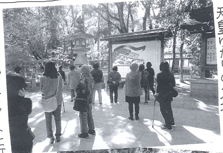
天皇ゆかりの神社