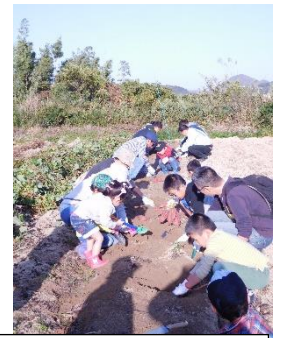
南：芋ほり 農協も注目