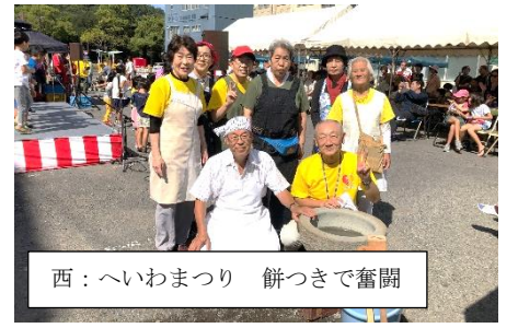
西：へいわまつり 餅つきで奮闘