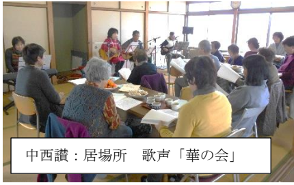
中西讃：居場所 歌声「華の会」