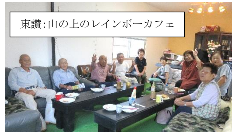
東讃：山の上のレインボーカフェ