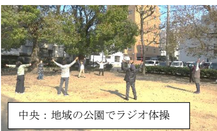
中央：地域の公園でラジオ体操