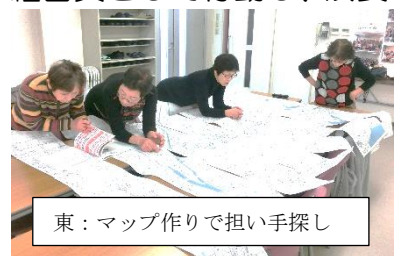
東：マップ作りで担い手探し