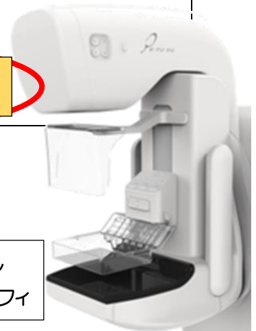
デジタルマンモグラフィ