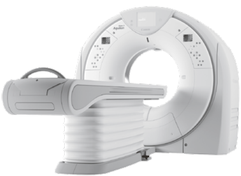
新しい機能も搭載された新型CT