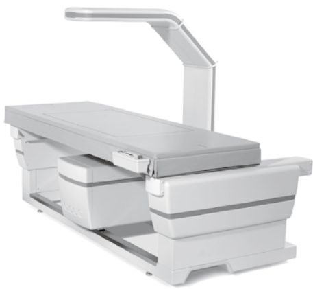
筋肉量も測定可能なDEXA

元気で長生きするために、ぜひ健康班会など地域で積極的に活動していただくとともに、早めにお気軽に平和病院を受診し、ご相談下さい。(高松平和病院放射線科)