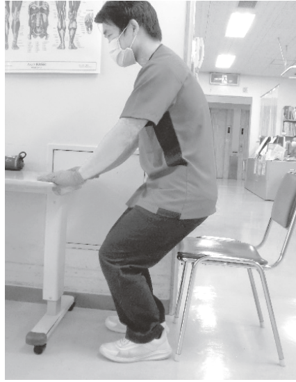
2. お尻を後ろに引くように、2～3秒間かけてゆっくりと膝をまげ、ゆっくり元に戻ります。