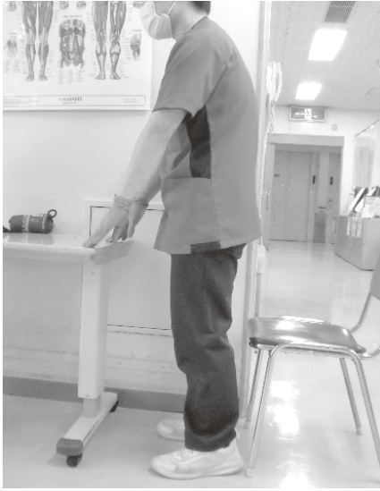
1. 足を肩幅に広げて立ちます。