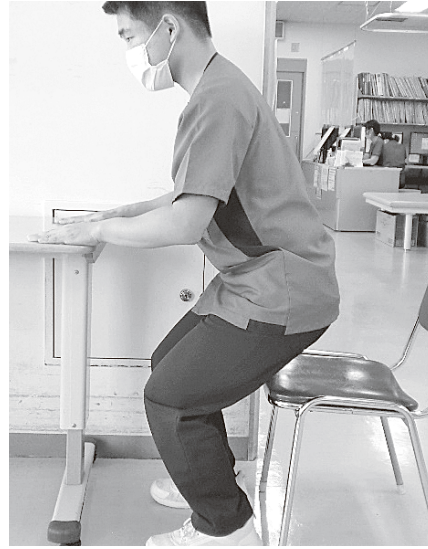
※スクワットができない場合は、イスに腰かけて立ち座りの運動を行います