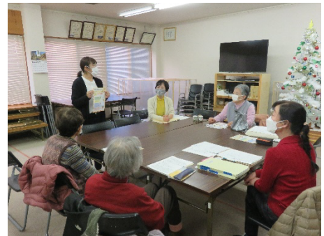
川村薬局長による説明