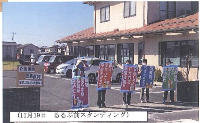
(11月19日 るるぶ前スタンディング)

11月19日、香川医療生協中西讃のブロックウォーキングで、丸亀城散策をしました。丸亀城の誇る石垣の石がどこから運ばれたのか、天守閣がなぜ隅にあるのかなど、詳しい説明をきくことができました。参加者からは「いままで知らなかったことが分かって、勉強になった」「参加して良かった」と喜びの声があがりました