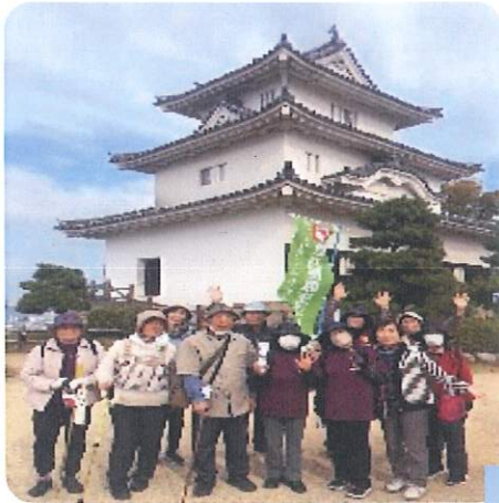
(天守閣にて参加者のみなさんと)