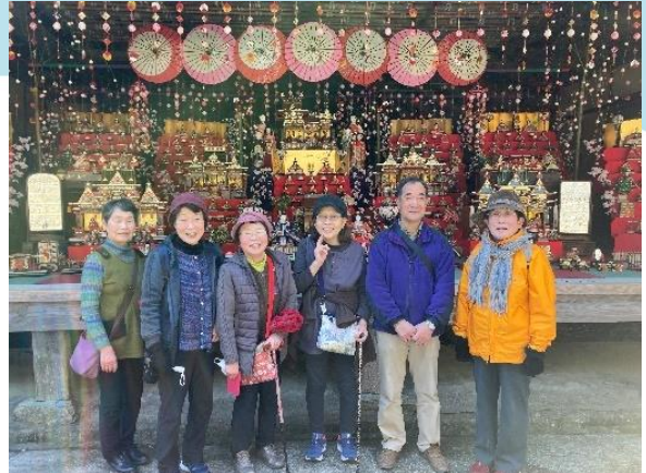
農村歌舞伎舞台に展示された雛飾りの前で

通算で8回目となったブロック健康づくり委員会主催の「ちょびっとウォーク」は、昨年4月にリニューアルした四国村と、同じく8月に屋島山上にオープンしたやしま〜るの散策企画を2月8日に行い、3支部から7名が参加しました。