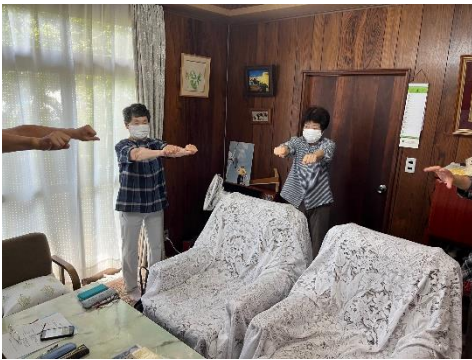
勝賀下笠居支部では、毎月の運営委員会で握力体操をしています