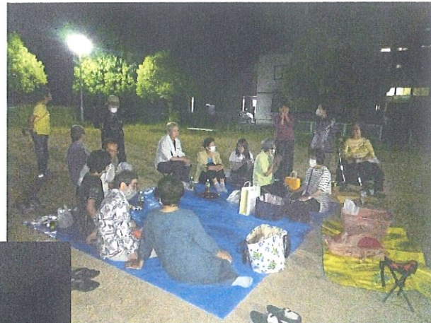
《お月様と公園の街灯と月見の人々》