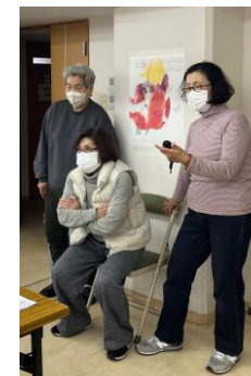
椅子立ち 上がり時間