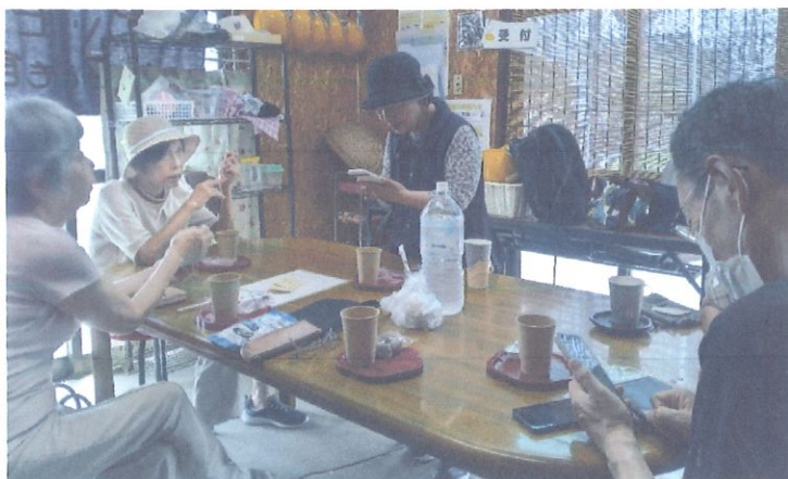
8月7日(水)健康チェックのあとのカフェでひと息です。