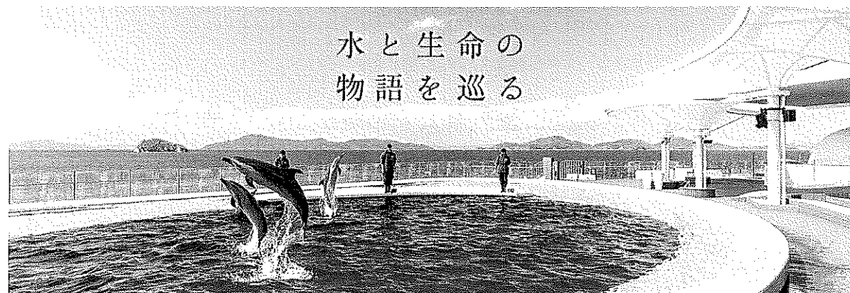
水と生命の 物語を巡る