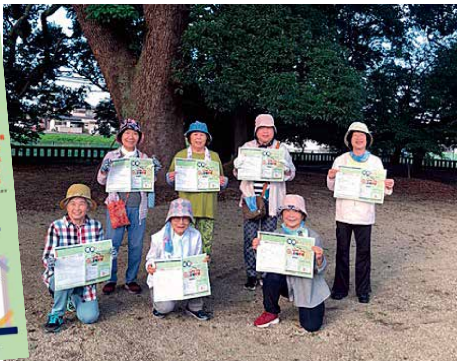
居場所活動で早朝にラジオ体操を行っている一宮支部のみなさん