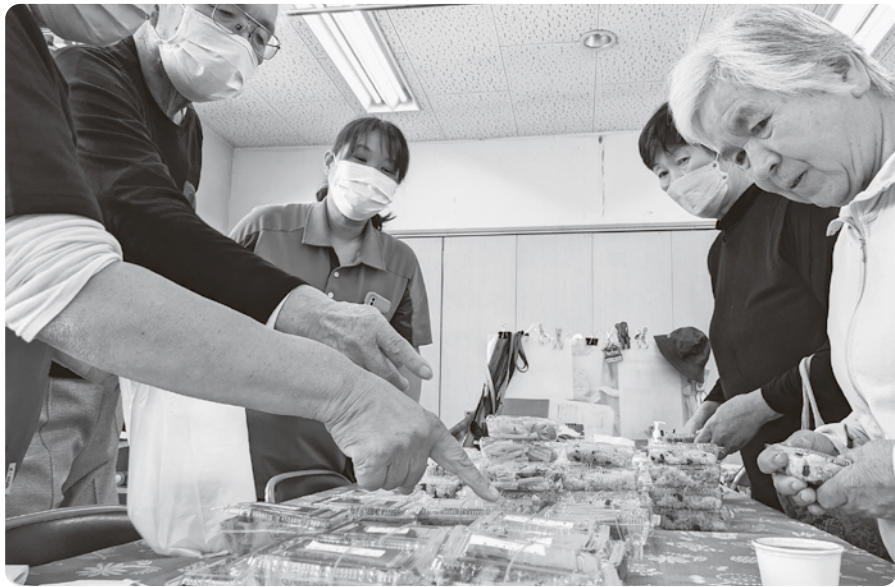
毎回多くの人を訪れるmikiカフェ

白山支部は、香川県東部に位置し、山のふもと、四国唯一のスケートリンクがある場所にあります。