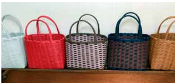
かごバッグ作りに挑戦 高松市 久米山げんき会