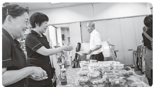
手作り総菜は職員にも人気

班もあり、組合員さんの高齢化が進み、班づくりが中々難しく、白山支部も昨年までは班づくりが目標達成する事ができなく、弱点のひとつでしたが、今年は、支部会終了時