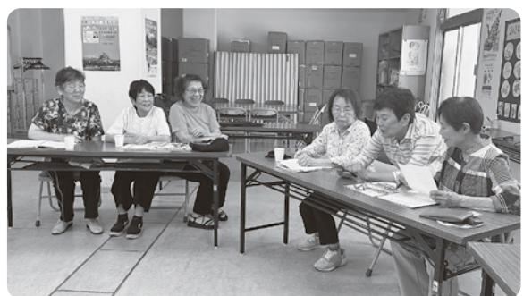
班会後のおしゃべりも楽しみ

「あめふり」などの季節の童謡や各自リクエスト曲を歌い、毎回最後は「今日の日はさようなら」で終わります。1時間〜1時間半の班会で15曲以上歌っていますが、みんなまだまだ歌い足りないようで、近いうちに班会後にカラオケに行こうと計画を立てています。