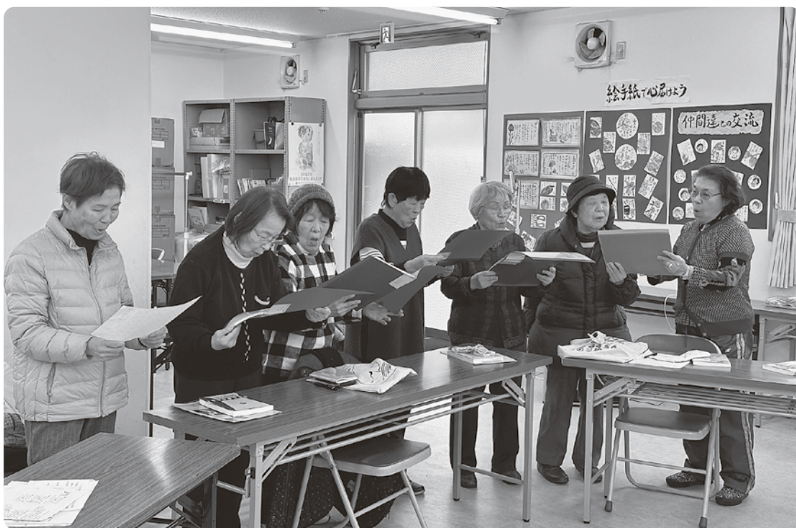
班会で歌う曲は15曲以上

名で構成していましたが、もっと人数を増やしたいと思いい、支部ニュースで広く参加者の募集を呼びかけたところ、問い合わせからの参加やその参加してくれた人からの紹介もあり、今では参加者が10名になっています。