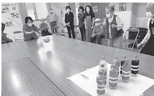
楽しく卓上ボウリングで交流

「きぼうのまちみき」通信② 前回の通信で皆様に土地が決まった事を報告しましたが、9月24日に3人の土地所有者の方と調印式も無事に終わりました。今は、さぬき市の「水地測量」に依頼をして2000坪の土地を測量してもらっています。地域の方々の話や昔の地図を見ていると、地図にはない水路や道を手作りしていたこと、地域を水害から守るために様々な工夫を凝らしてきたことなど、人々の歴史と苦労が蓄積されてきたことに思いを馳せることができます。先祖代々受け継がれてきた宝の土地を引き受け、医療生協の診療所として発展させ「きぼうのまちみき」を実現させるべく、決意を新たにさせられました。