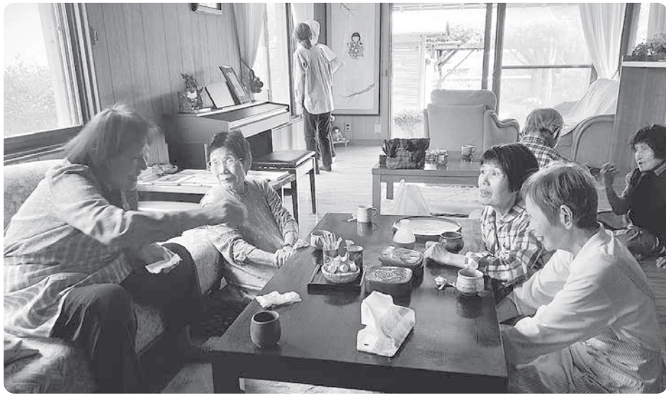
認知症カフェ思音の様子

民は認知症に関する知識は十分すぎる程、身に付けているが、生活に活かせる知識とは言いがたい出会いが多くある。原因の一つとして、実体験から得た知識ではないからだと思う。実体験から得る知識をどの様に地域の人達に伝えて