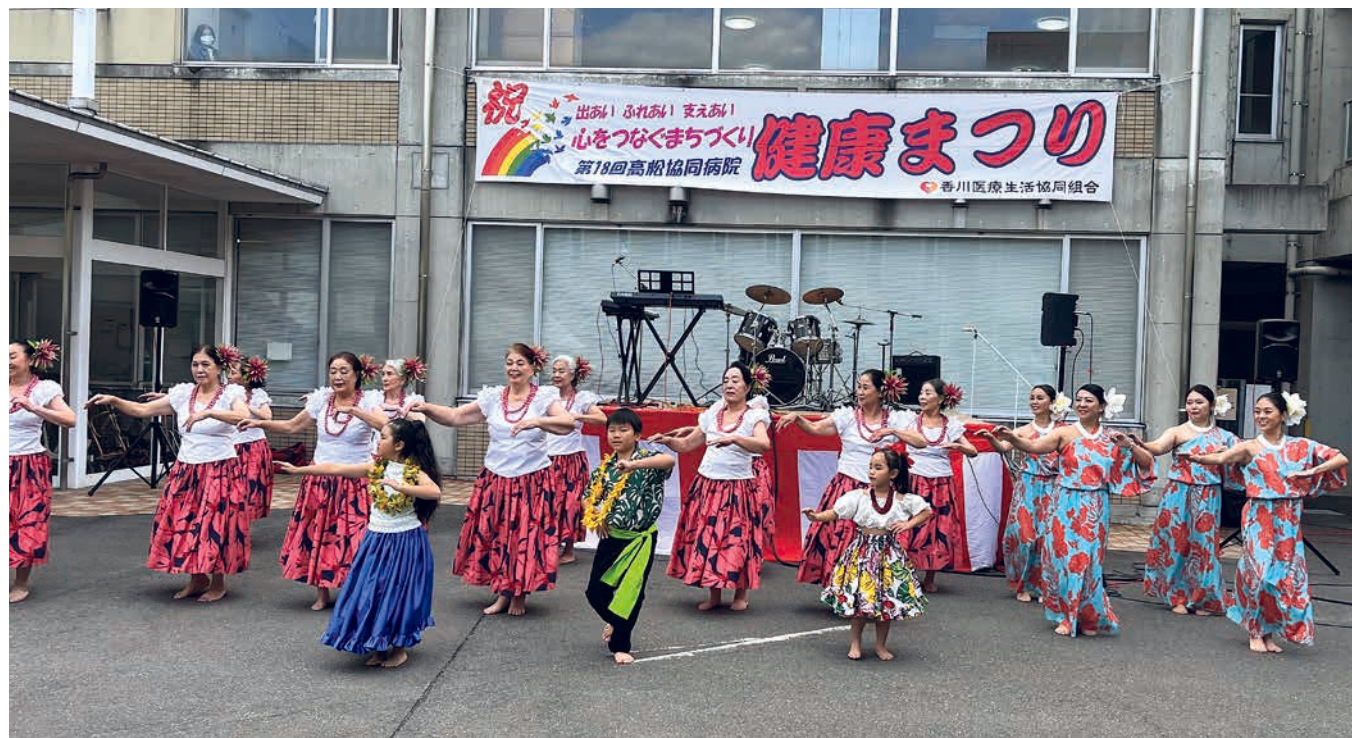
5年ぶりの開催となった第18回高松協同病院健康まつり

香川医療生活協同組合 発行責任者／小池康有 編集／機関紙編集委員会 〒760-0073 高松市栗林町1-3-24 ホームページ http://www.kagawa.coop/ インスタグラム ホームページ