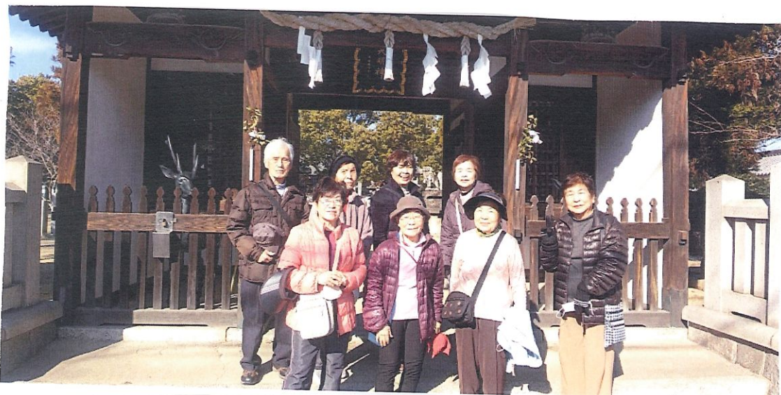
おしゃべり散歩会で春日神社へ初詣に行きました。

まだまだ寒い毎日ですがお変わりなくお過ごしでしょうか？春のお花見が待ちどおしいですね。インフルエンザが流行っています。うがい手洗い保温に気を付けてお過ごしください。3月のましかど健康チェックとみんなのカフェは祝日のためお休みとなります。