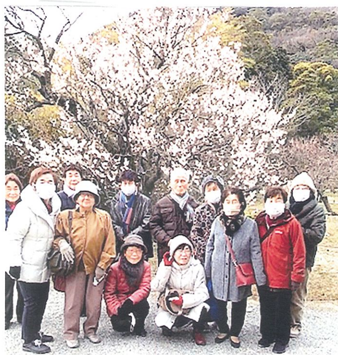
栗林公園梅見散歩