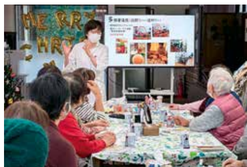
管理栄養士による説明に参加者も大いに納得

香川医療生協では、昨年よりフレイル予防の観点から「フレイル測定会」を実施し、そのためのフレイルサポーターを養成してきました。昨年養成講座を受講した方の更新49名、新規受講者79名で、合計128名の方がフレイルサポーターとして登録されました。そして、今年も2年目の