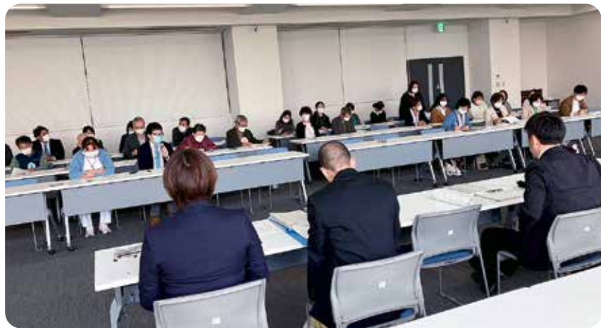
キャラバンでは現場の声を自治体に伝えます

止に伴う医療や介護現場での混乱や負担が大変ななっている。 ①から⑤の声は厳しい実態のほんの一部であり、これらに対して、国も地方自治体も実態の把握と対応が不十分です。各団体や住民の皆さんの声を懇談の中でお伝えし、県・国への働きかけと自治体の独自施策を強く求めていきたいと思いま