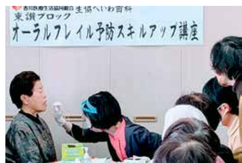
歯科衛生士による舌圧測定を体験

東讃ブロックでは、昨年12月16日に「スキルアップ講座 栄養編」として、高松協同病院の管理栄養士を講師に、組合員18名・職員3名の参加で行いました。講師の専門職としての食料や調理の説明や具体例（飲み込みやすくするなど）に、普段主婦として食事作りをしているだろう組合員さんは、みんな真剣に聞いていました。バランスよく多くの食品とること、すこしおへの努力が必要だと