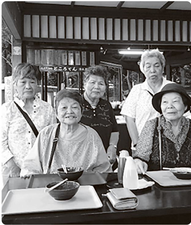
八十場で「ところてん」を食べました

数年前から我が家で居場所「のんびりカフェ」を月1回開いています。自宅介護4年、93歳で亡くなった母が、「我が家にご近所さんが集まっておしゃべりたい」とよく言っていました。母が残した家でのんびりと居場所ができればと始めました。