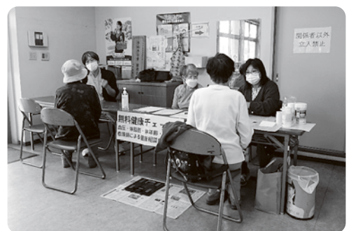
JA木太支店でのまちかど健康チェック

居場所下川ほがらか会は、季節の行事を取り入れながら体操や脳トレ、合唱など2時間を楽しく傍ら、毎月の健康チェックも欠かさず。1月の班会では、健康チェックの後フレイルチェック測定を行い、半年