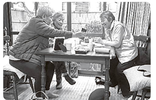
お部屋でおしゃべり

初めのうちは口数の少ない方もおられましたし、私も何か準備をしなければと悩みましたが、皆さんのご希望が「一人でテレビを見ながら宅配の弁当を食べるのは美味しくない」「おしゃべりしたい」「子どもが来た時しか外出が出来ない」「お買い物に行きたい」でした。私が計画を立て準備し、参加の方がお客様では本来の居場所ではないと学びました。