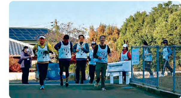
9条碑建立1周年イベントで行ったピースマラソン