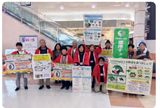
昨年10月から始めたイオンモール綾川でのまちかど健康チェック

● ※地域包括ケア病床・病棟：急性期の治療を終えて病状が安定しているものの、すぐの退院が難しい患者様などに対して、在宅復帰に向けた支援や準備を行うことを目的とし