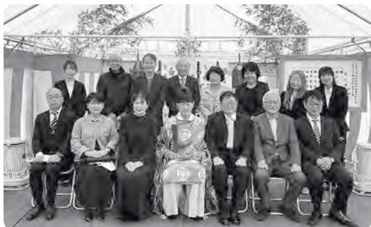
工事の安全と建物の繁栄を祈願した地鎮祭

1月末に開発工事が終了し、現在は建物の建設工事へと進んでいます。日に日に形になっていく様子に、完成への期待も高まっています。2月11日には地鎮祭を執り行い、医療生協の代表者10名と香川保健企画の4名で、土地の神様に工事の安全と建物の繁栄を祈願しました。「きぼうのまちみき」には薬局も参加します。これまでの通信でお伝えしてきたとおり、香川保健企画が栗林公園前薬局に次ぐ2号店を開設予定ですが、このたび名称が「なないろ薬局」に決まりました。みき診療所とともに、どうぞよろしくお願いいたします。今後行事が続ぎ、5月末には棟上げを予定しています。完成まではいよいよ半年を切りました。最後まで気を引き締めながら、地