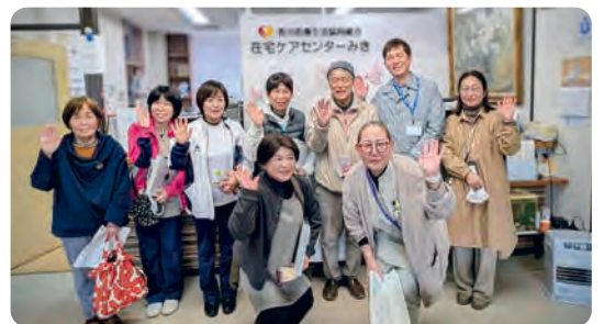
きぼうのまちみきプロジェクトで毎月取り組んだ 組合員訪問活動

● テーマ「新しい医療生協活動の展望を描き、 未来に向けて発展していくつ。 かけがえのない平和と暮らしを守ろう」