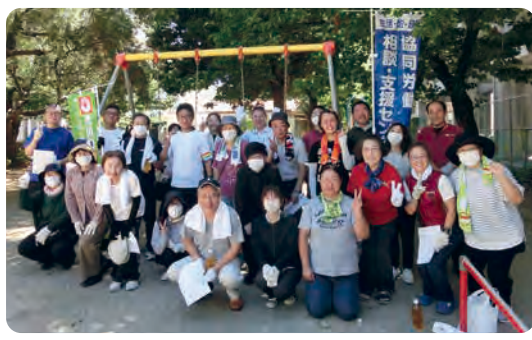
ワーカーズコープと協同行った地域清掃活動

● 地域組合員と職員組合員 の活動交流を深めます。 ● かがわ働き方改革推進宣 伝活動