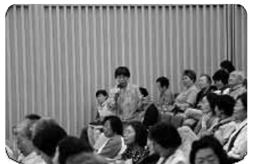
フロアからも次々と発言

た健康づくりを通して「まちづくり」「ひとづくり」をしています。一人一人の支部の運営委員さんが、地域の協同を育む職人でありたいと思っています。「地域まるごと健康づくり」を通して「出会い・ふれあい・支えあい」を広げているとのこと。そして、最後に「みなさん、こんな楽しいこと、職員にお任せできますか？」という言葉で締めくくられました。