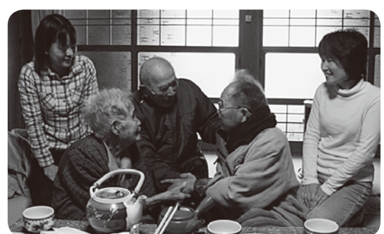
「また来てな、約束やで」