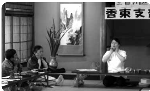
みんなでくりくり… 唾液を出すマッサージを習いました！