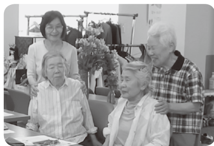
ふたりでやると、う〜んと気持ちいい…超かんたん！リラックス体操！