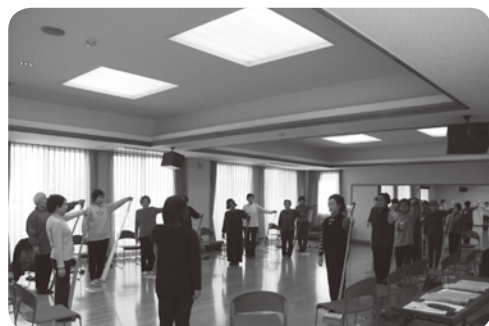
川添コミュニティセンターでのセラバンド体操