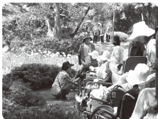
菖蒲をながめながら水分補給

この日は晴天で、「外の風は気持ちいいなあ」と利用者さん。車いすを押すご家族や組合員さん達も手慣れたもので、利用者さんと楽しく会話をしながら一緒に咲き誇る菖蒲を楽しみました。