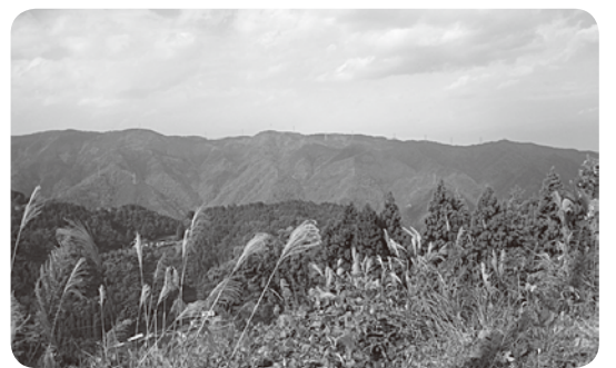
海拔540mの絶景の地でした

に行くことになりました。高速道路で一時間ほどの距離で高速代とガソリン代が必要で、外来職員が知恵