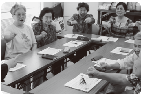
あと出しジャンケンで大爆笑！