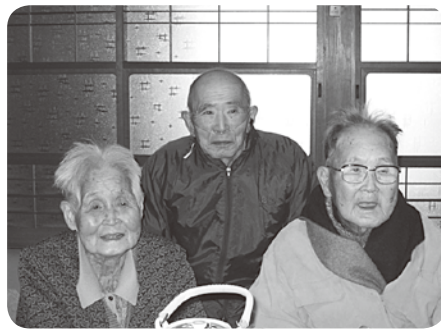
「よう来てくれた」と大歓迎

頻回に下痢をして食事も満足にとれず、毎日診療所に通院してくるAさん、毎日往復するだけでは張り合いが無いのではと思ひ外出支援を企画しました。 話を聞くと隣のB町の出身で小学校の同級生Cさんがただ一人生き残っているとのこと、Cさんに会い