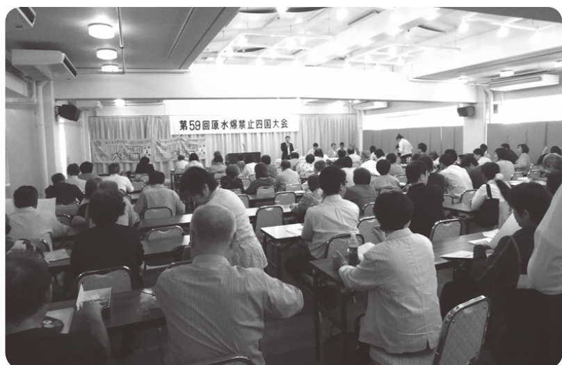
第59回原水爆禁止四国大会