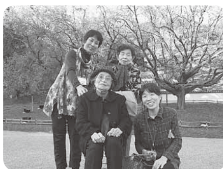
利用者様とのリフレッシュ旅行

「認知介護」も増えているのを実感しています。このような状況のうえ、更に、国は地域包括ケアシステムを掲げて在宅の流れを一層強いものにしていくとしています。だからこそ、私たちは当支援センター事業所宣言を掲げ所に「その人らしい生活」を支援していくことが求められており、ご本人の「尊厳」を守り、「自己決定」を応援できる職員でありたいと、そして高松平和病院を中心に法人内の各事業所と連携して自宅で安心して暮せるお手伝いができたらと思っています。