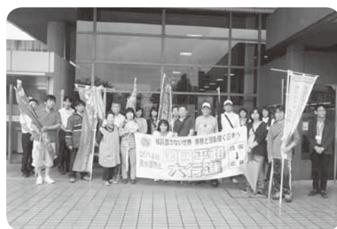
三木町役場で(昨年の平和行進)

民が誇りとする憲法九条を 自衛権」を許さず、日本国 争する国づくり」「集団的 に立つよう求めます。「戦 よびかけ、政府にその先頭 止を求める連帯した行動を 声を合わせ、核兵器全面禁 世界の人々、すべての人が として、日本の草の根から 史の節目にふさわしい行進 進は、被爆七十年という歴 七十年目の夏を迎えようと しています。