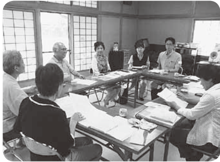
退院患者様へのサポートを話し合います