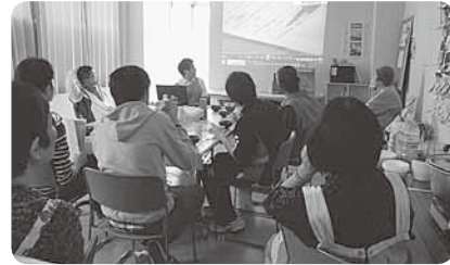
ランチミーティングで組合員さんも医学生と交流