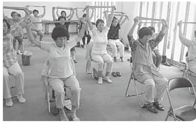
たまり場で多彩な健康づくり