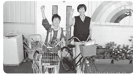
パディ活動で地域訪問に出発