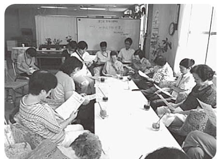
「ほのぼの介護教室」の様子

ら十四時頃まで、高松平和病院の外来待合いで「禁煙教室」を開催します。無料でニコチン依存度をチェックしたり呼気中一酸化炭素濃度の測定も行ってもらいます。また希望者には肺活量測定(別途実費必要)も予定しています。ぜひ気軽に参加していただき、受動喫煙も含めたタバコの害及び禁煙の重要性について一緒に学習しましょう。