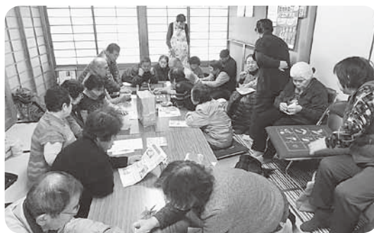
居場所「いきいき水田」のようす

「高齢者の居場所づくり」に川添地域の川向地区が認定され、医療生協川添支部が協力することになりました。会の名称を「久米山げんき会」と名づけ、六月より毎週木曜日に午後二時から四時まで開いています。