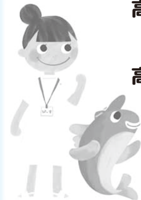
マスコットのピースちゃん(左)とタカビー(右)