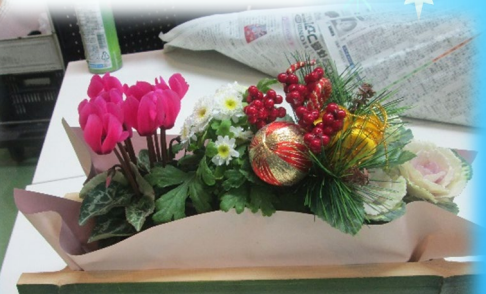
とても美しく出来ました！