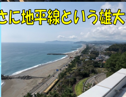
まさに地平線という雄大さ