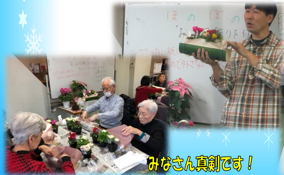
みなさん真剣です！