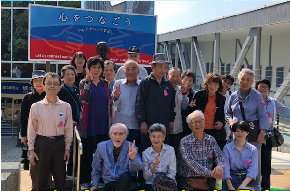
参加者全員で記念写真