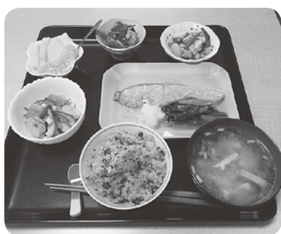
あったか手作りの食事

訪れると家に帰ったような懐かしさと安心感があります。また、施設の周囲には田園風景が広がり、小さいけれどテラス席のある庭には四季折々の花が咲きま