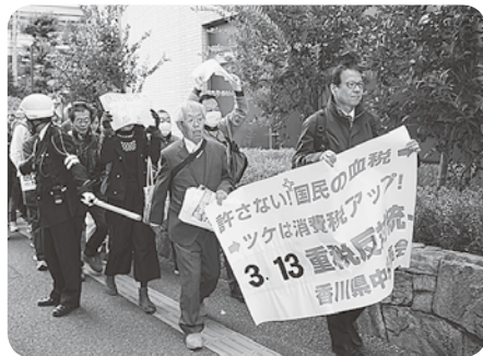
消費税増税に反対するパレード

医療機関が行う保険診療は、非課税とされていますので、患者様に消費税の負担は生じません。しかし保険診療を行う医療機関は、医薬品の仕入れだけでなく水光熱費などの諸経費や医療機器の購入費など非課税となった売上げに係る消費税部分の仕入れ税額を控除することができません。保険診療は各医療機関が任意に価格設定できない「公定価格」ですので、非課税売上げに対応する部分の消費税を医療費に転嫁できず医療機関が負担する「損税」が発生することとなります。