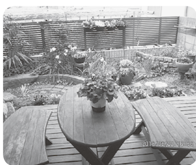
花いっぱいテラス

訪れると家に帰ったような懐かしさと安心感があります。また、施設の周囲には田園風景が広がり、小さいけれどテラス席のある庭には四季折々の花が咲きま