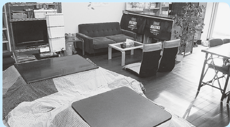
学びと交流のスペース「サポセン」

また医学生の奨学金制度もあり、生活や学習の援助も行っています。ご子弟やお知り合いの方に医学生・医師を目指す高校生や予備校生がい