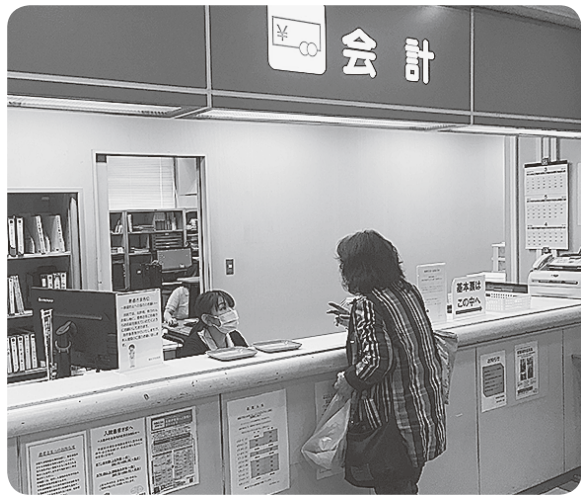
消費税は患者様のくらしと病院経営に大きな負担