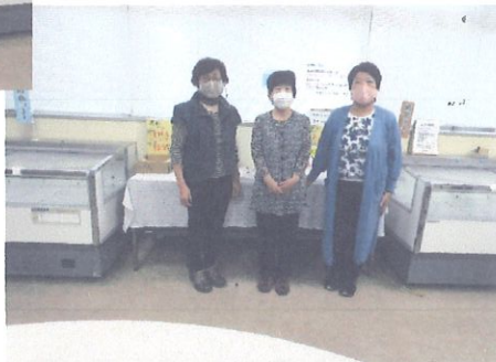
たんぽぽ班の皆さん