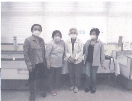
ことり班の皆さん