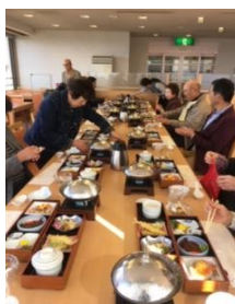
支部レクレーション 2019/11/21(木)