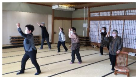
ゲッターマン体操