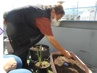
大根といんげんの種を植えました