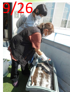
肥料入れて土づくり