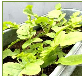
2F デイのベランダ 大根