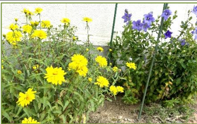
玄関横の百日草とキキョウ